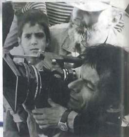
Apukájával, szintén egy filmfotóval